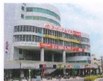
■スーパーアルプス北野店

SINCE 1906 宅建業部知事免許(9)第51317号 建設業部知事許可(般-3)第75744号 日本住宅保証検査機構登録A0300888 (公社)東京都宅地建物取引業協会会員 (公社)全国宅地建物取引業保証協会会員 (公社)首都圏不動産公正取引協議会加盟