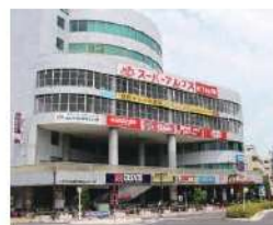
■スーパーアルプス北野店

SINCE 1906 宅建業都知事免許(9)第51317号 建設業都知事許可(般-3)第75744号 日本住宅保証検査機構登録A0300868 (公社)東京都宅建建物取引業協会会員 (公社)全国宅建建物取引業保証協会会員 (公社)首都圏不動産公正取引協議会加盟