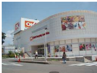
■オーケストア多摩大塚店